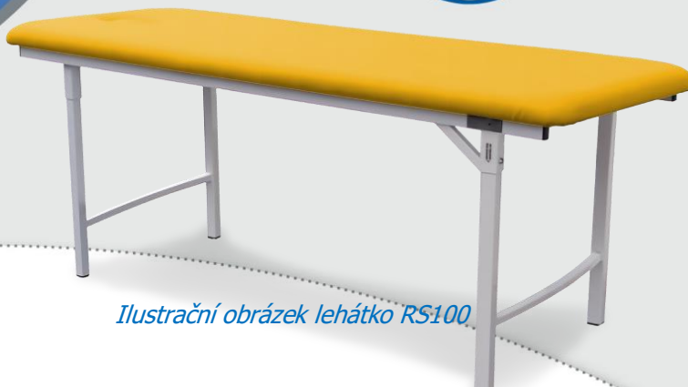
Ilustrační obrázek lehátka RS100